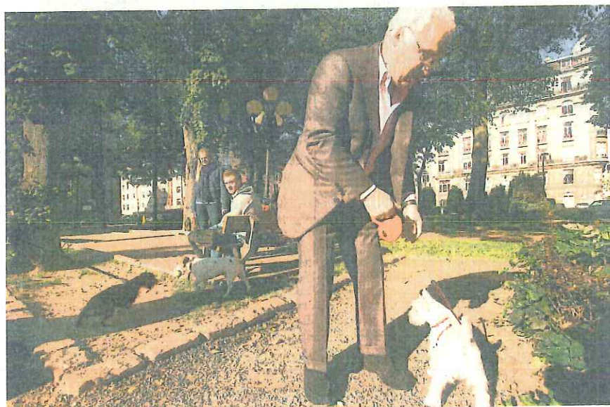
De Brugmann-wijk is een van de trekpleisters in Brussel voor gefortuneerde Fransen.

leen veel geld meebrengen naar Brussel. 'Ze zorgen ook voor jobs. Ik ken geen enkele actieve ondernemer die na zijn verhuizing is blijven stilzitten. Binnen de twee jaar hebben ze hier allemaal een eigen bedrijf opgestart.' Met hoeveel de Franse belastingvluchtelingen inmiddels zijn in België, is niet geweten. Exacte cijfers zijn nergens beschikbaar. Maar volgens de meeste schattingen zouden er in ons land minstens 15.000 tot 20.000 zijn, volgens sommigen zelfs meer. Het gros daarvan heeft zich gevestigd in de zuidelijke Brusselse gemeenten, zoals Ukkel en Elsene,