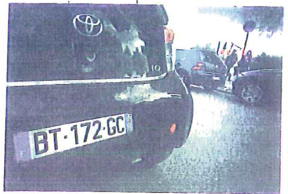
Veel Fransen kiezen bewust voor een onopvallende kleine auto.

De nieuwe golf Franse belastingvluchtelingen is opvallend, want sinds 2007 - toen Sarkozy verkozen werd als Franse president -